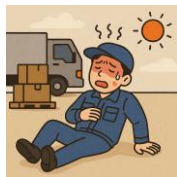
運送業における熱中症の推移（人）

なお、熱中症はドライバーだけでなく、 構内作業員 によるものも増加しており、注意が必要です。